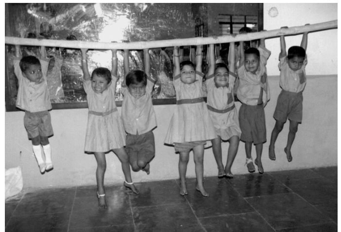
L'heure de la Gym chez les petits!

Création d'une école maternelle dans chaque village, et formation de monitrices issues des villages. Outre l'intérêt pour les enfants, ce programme a pour but de permettre aux éducatrices de gagner leur vie, d'apporter un complément de revenu à leur foyer, et surtout de se valoriser socialement et d'améliorer leur statut de femmes dans leur propre famille. 50% d'entre elles sont mariées. Ce projet est soutenu par le Comité de Genève